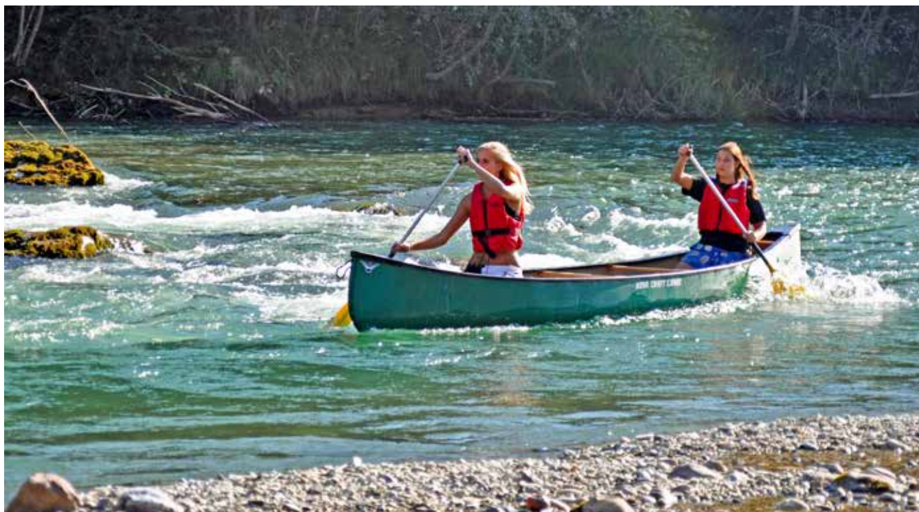
Kanutour in die Schütt